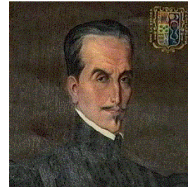
Garcilaso de la Vega

El hecho de regalar un libro está relacionado con Cervantes y Shakespeare. Estos soberbios escritores han pasado a la Historia por sus fabulosas obras, llegando a ser un símbolo importante en sus respectivos países. El mundo reconoce el trabajo de estos genios celebrando cada 23 de abril el Día del Libro. Así se hizo. De aquí la costumbre de regalar un libro. Además, esta jornada es muy apropiada para lanzar al mercado nuevas novelas, muchos autores la aprovechan y promocionan su último libro, y de paso quizás puedas conseguir un autógrafo de tu escritor favorito.