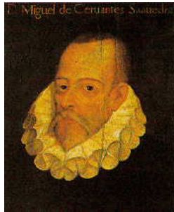
Miguel de Cervantes

El 23 de abril se conmemora el fallecimiento de tres escritores: el español Miguel de Cervantes y Saavedra, el inglés William Shakespeare y del cronista Garcilaso de la Vega (el Inca), todos ocurridos en 1616. De esta forma, la Unesco en 1995, aprobó proclamar el 23 de abril de cada año el "Día Mundial del Libro y del Derecho de Autor".