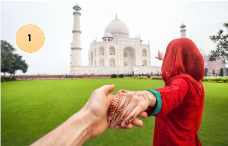
2-El Taj Mahal, India.

El famoso mausoleo, símbolo de amor eterno, pelagra de que pueda derrumbarse. Es la atracción más visitada en la India , pero sus cimientos se están pudriendo y la contaminación está dañando el mármol de la fachada, que poco a poco se desvanece. A principios de 2018, India anunció que el número de turistas extranjeros se limitará a 40.000 por día.